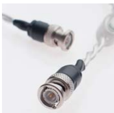
デジタルケーブル Digital Cable