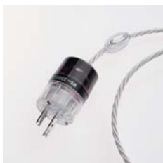
パワーケーブル Power Cable