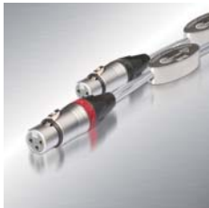
インターコネクトケーブル Interconnect Cable