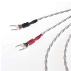
スピーカーケーブル Speaker Cable