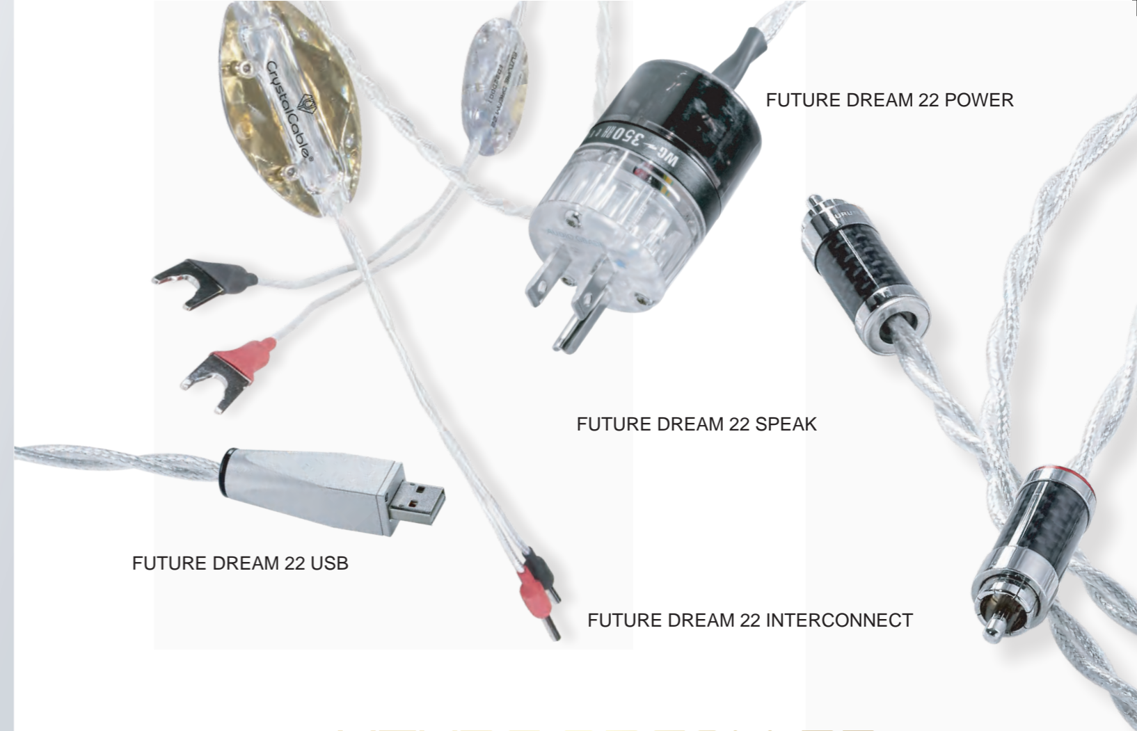
FUTURE DREAM 22 USB

Future Dream 22 では Crystal Cable のお家芸である 2 ワイヤー同軸設計を採用し、2 つのピュアシルバー冶金を組み合わせています。さらに、デュボン社 Kapton と Teflon による 2 重絶縁と 2 重シールドという「22」にふさわしい仕上がり。音のアウトラインから細部に至るまでのディティールのすべての音楽情報を知ることができるでしょう。