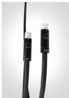
■ Interconnect XLR