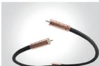
■ Interconnect RCA