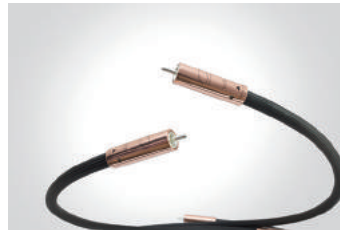
■ Digital Cable RCA&XLR