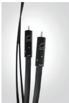
■ Interconnect RCA